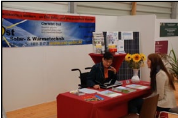
Messestand inkl. Strom