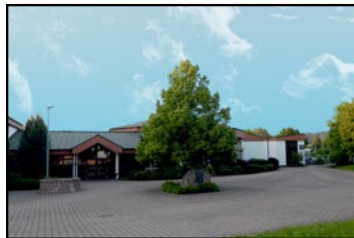
Außenfläche: Freiflächen für Fahrzeuge, Messetrucks, Maschinen etc.