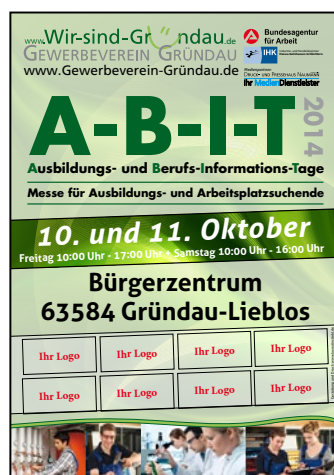
Plakatwerbung Ihr Logo auf unseren Plakaten