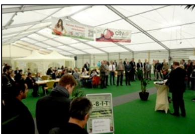
Bannerwerbung - wir bringen Sie groß raus Wir platzieren Ihr Banner gut sichtbar in den Messeräumen, bitte 1 Woche vor Messebeginn anliefern.