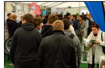
Zielpublikum: Wir sorgen für die potenziellen Auszubildenden und Fachkräfte