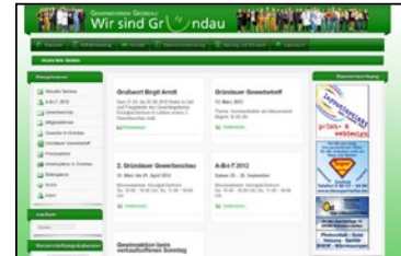
Auf unserer Webseite Firmenname, Kurzinfo, Logo, Link zu Ihrem Internetauftritt