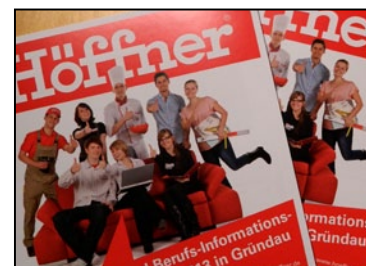
Artikel und Anzeige im Veranstalterkatalog (bei Anmeldung bis 01.09.2014 und direkter Lieferung der Werbung)