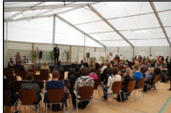
Vortragsmöglichkeiten Vorstellung/Vorführung von Projekten