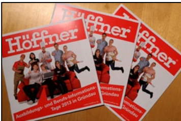
Eintrag im Veranstalterkatalog Wir veröffentlichen Sie im Ausstellerverzeichnis